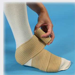
Inkl. ankel wrap