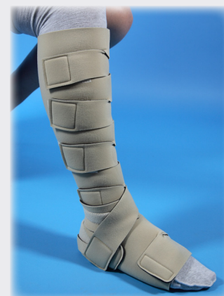
Juxta-Fit™ BD & Juxta-Fit™ AB

Specialfremstillede: Kan laves efter mål til hele benet.