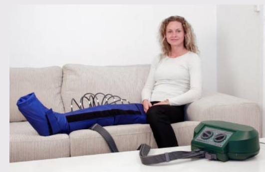
Lympha Press Mini med stövelmanschett