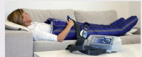
Lympha Press Optimal med byxmanschett

Nyframtaget "click-on"-stick som underlättar slangmontering på pumpen.