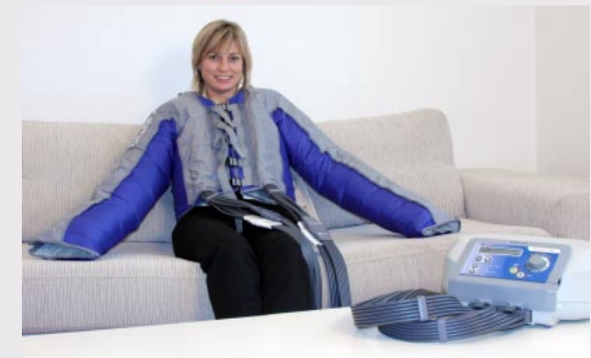
Lympha Press Optimal med jackmanschett