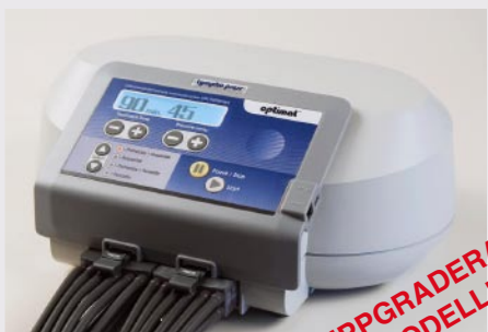
Lympha Press Optimal

Lympha Press Optimal - Kompressionspump med fyra olika kompressionscykler: