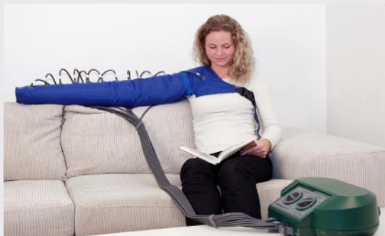
Lympha Press Mini med arm- och skuldermanschett

Lympha Press är en medicinskt dokumenterad elektrisk apparatur som kan avhjälpa patientens problem förorsakade av bl.a. ödem i lymf- och vensystem.