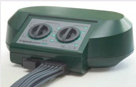
Lympha Press Mini

Kompressionspump med Lympha-cykel. Pumpen är enkel att hantera, trycket kan ställas in mellan 20-80 mmHg. Den är så tystgående att man kan titta på TV eller ligga och läsa i sin säng.